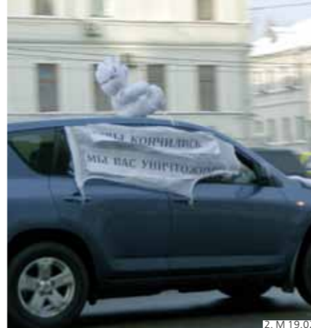
2. М 19.02