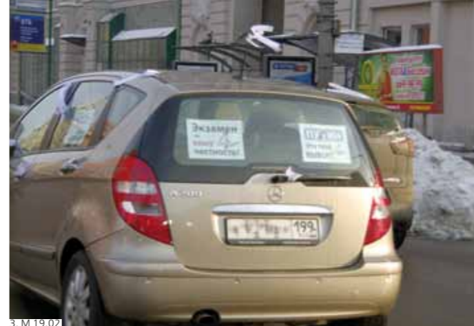
3. М 19.02