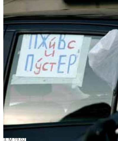
3. М 19.02