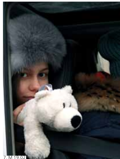
7. М 19.02