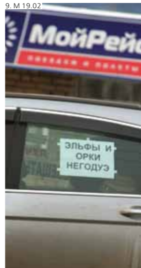
9. М 19.02