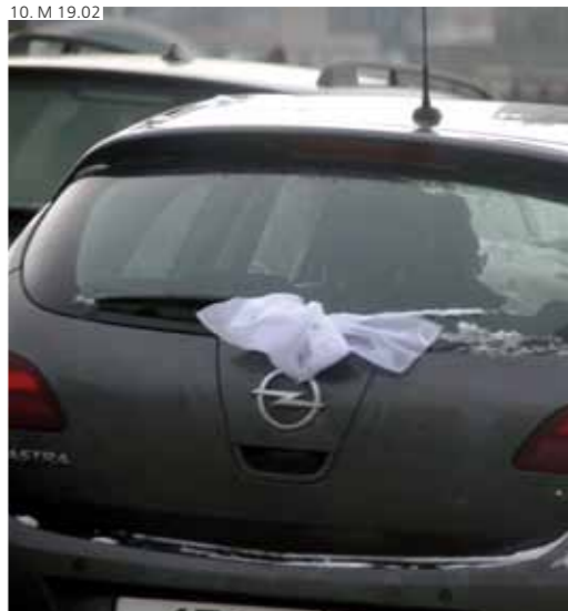
10. М 19.02