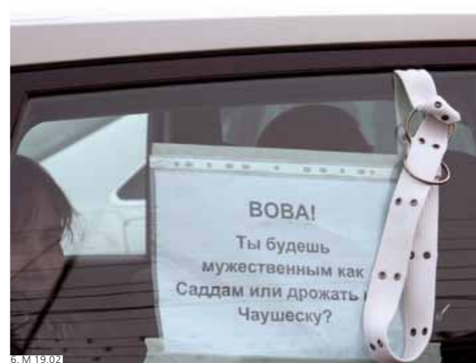
6. М 19.02