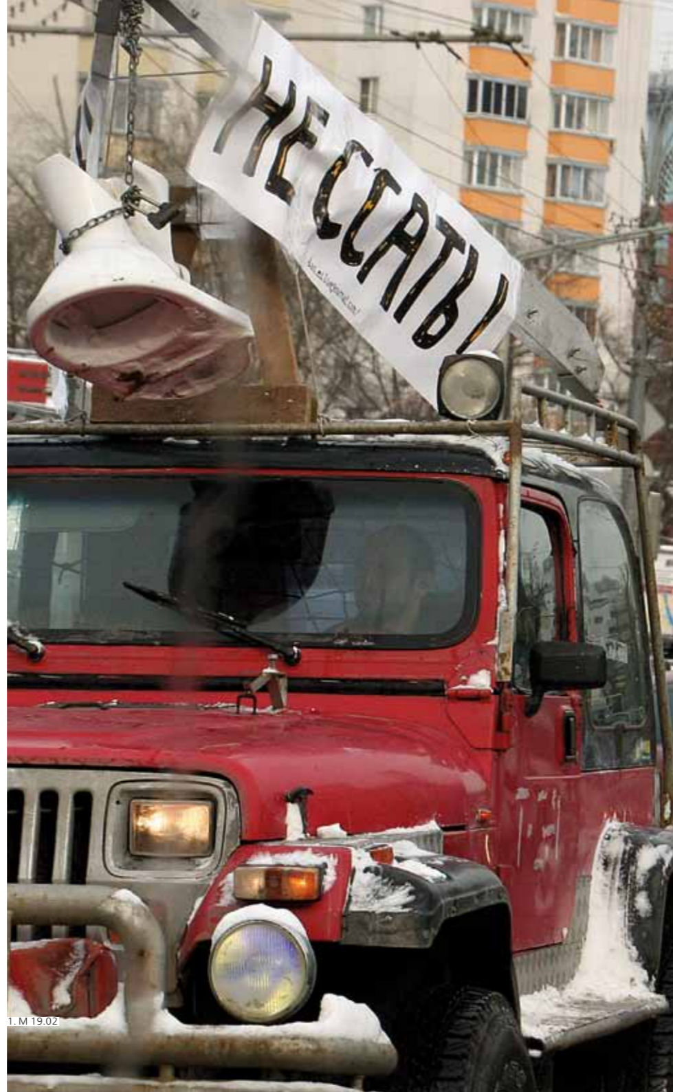
1. М 19.02