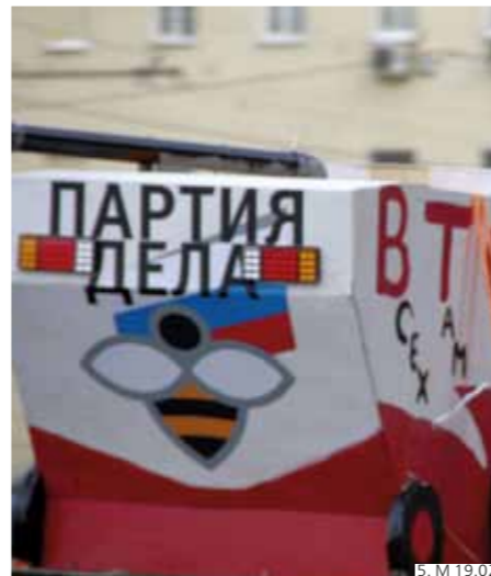
5. М 19.02