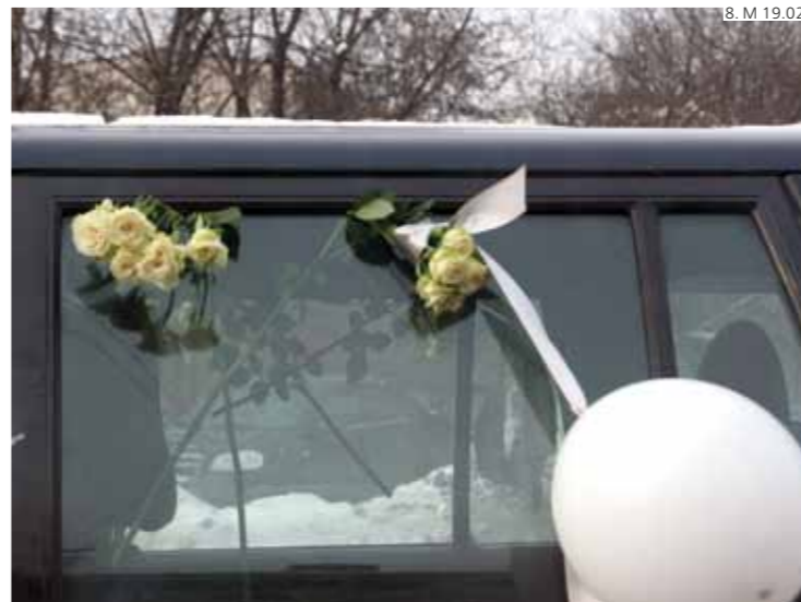
8. М 19.02